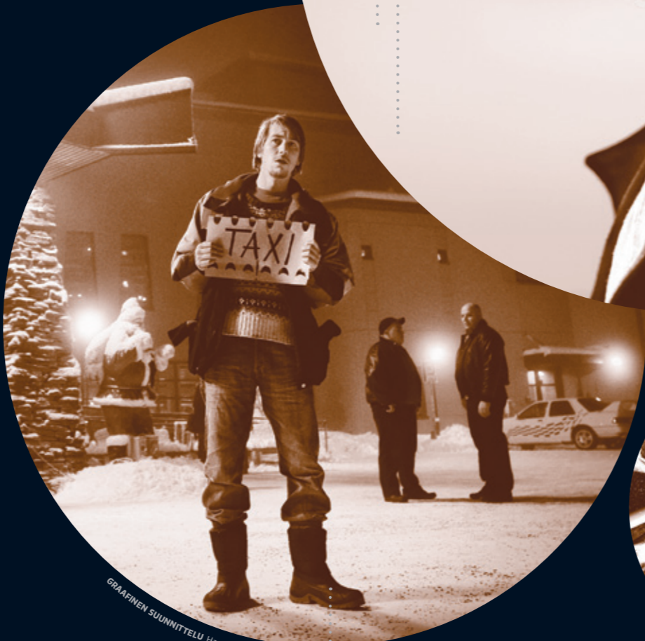
GRAAFINEN SUUNNITTELU Hanna Lahti / Huomen GDI

Suomen elokuvasäätiö Kanavakatu 12 FI-00160 Helsinki p. (09) 6220 300 ses@ses.fi www.ses.fi