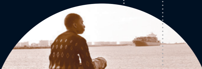
TAKAKANSI • NAPAPIIRIN SANKARIT (2010), OHJAUS DOME KARUKOSKI