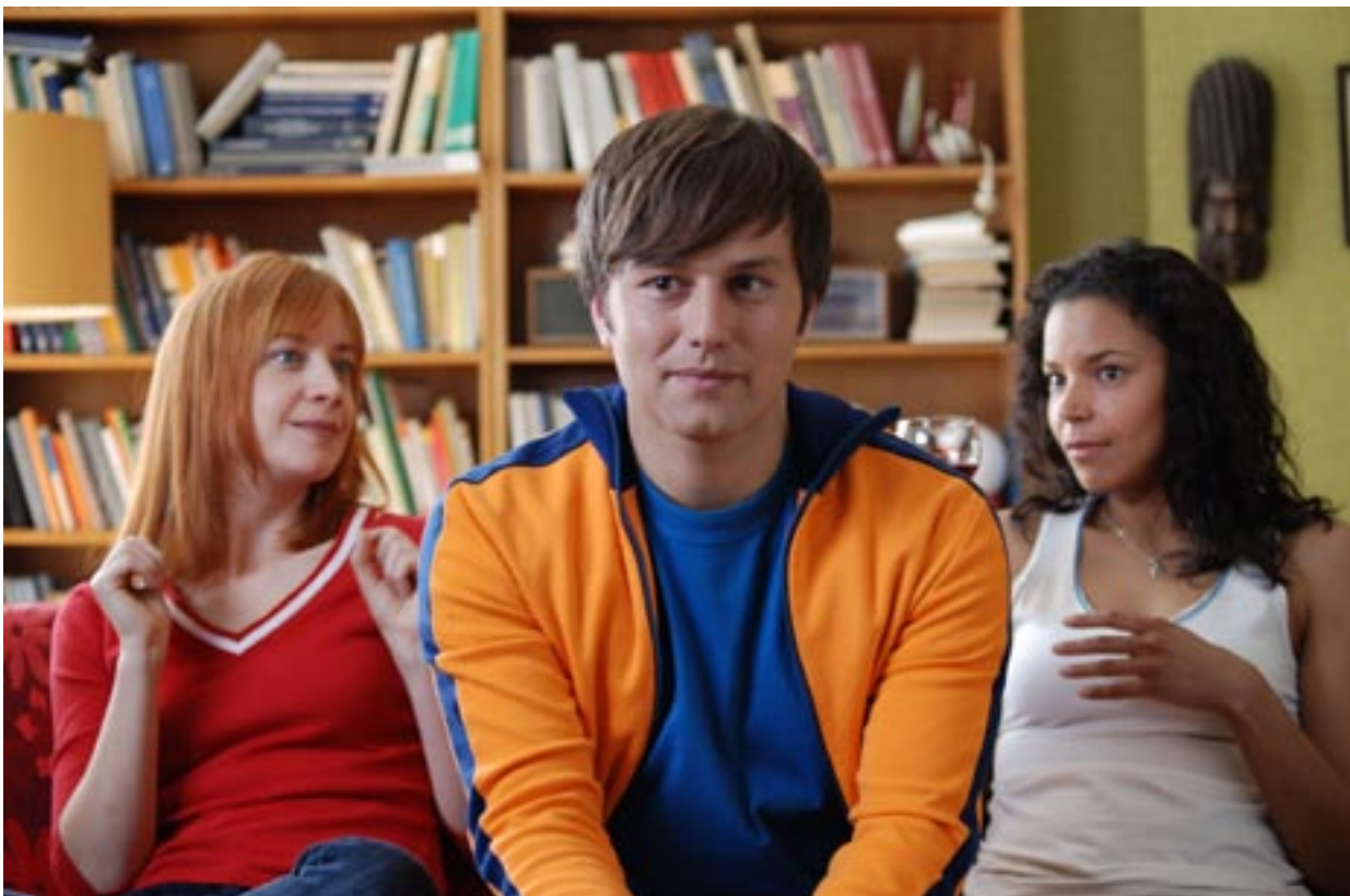
Maata meren alla