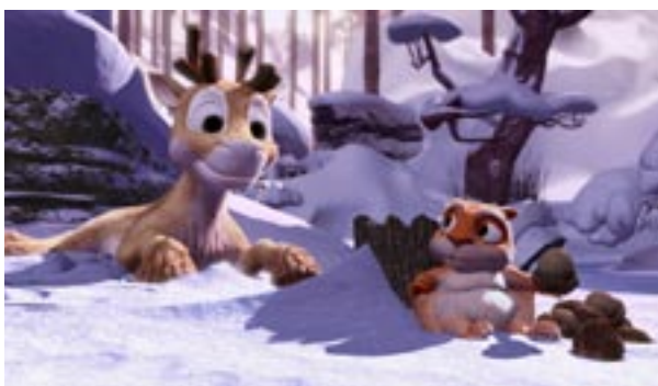
Niko – lentäjän poika

NIKO – LENTÄJÄN POIKA elokuvan ranskalainen levittäjä BAC Films sai parhaan eurooppalaisen levittäjän palkinnon Cartoon Movie -tapahtumassa Lyonissa. Palkinnon valitsijoina oli eurooppalaisen animaatioelokuva-alan kerma, tuottajista, rahoittajista ja levittäjistä koostuvat noin 700 ammattilaista, jotka osallistuivat 11. kerran järjestettyyn eurooppalaisen animaation rahoitustapahtumaan.