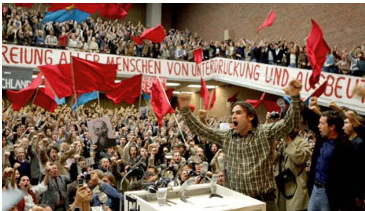
Baader-Meinhof Komplex oli yksi seitsemästä Media -tukea saaneesta Oscar-ehdokaselokuvasta