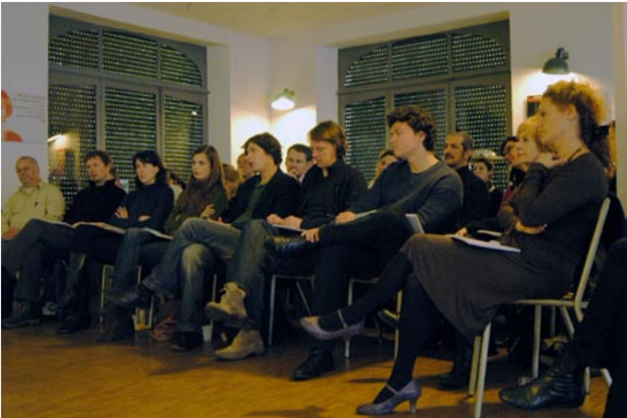
Script & Pitch -workshop 2007