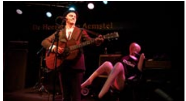
Mies ja kitara taustalaulajineen