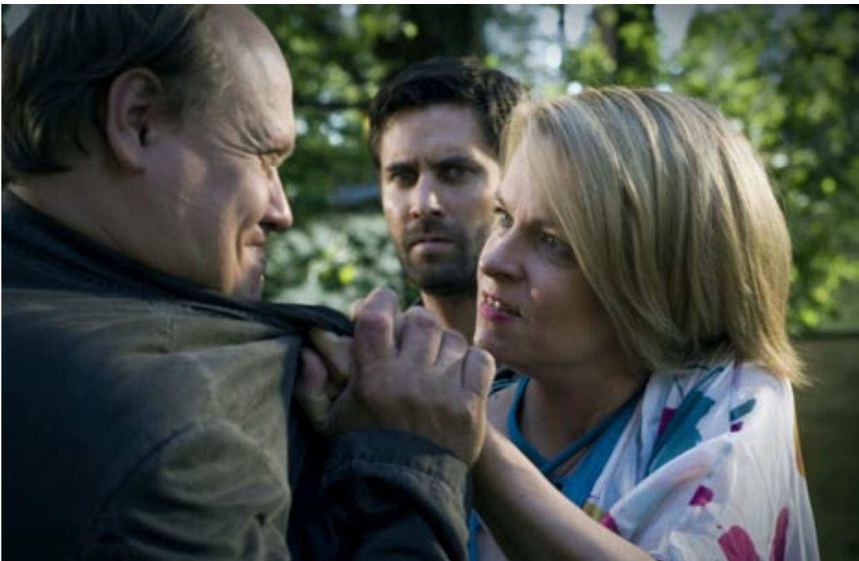
Mika Kaurismäen Haarautuvan rakkauden talo (2009) sai Median hankekehittelytukea 60 000 euroa vuonna 2008

Hakukelpoisen yhtiön ehto on, että se on vähintään vuoden vanha ja sen tulee olla tuottanut päätuottajana elokuva/tv-ohjelma, joka on saanut levityksen 1.1.2007 jälkeen. Tuotetun elokuvan genre on vapaa, se voi olla fiktio, animaatio tai dokumentti. Pelkkä kansallinen levitys riittää! Sales agent -sopimus riittää todistukseksi levityksestä, myyntiraportti ei ole välttämätön. Jos yhtiö ei ole tuottanut aiemmin mitään, voidaan ottaa huomioon yhtiössä vähintään vuoden työskennelleen tuottajan aiempi kokemus.