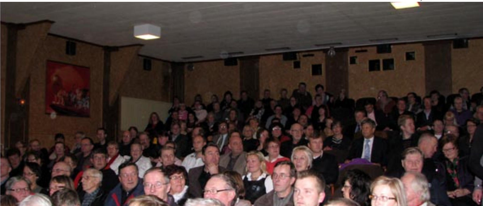
Matin-Tupa täyttyy houkuttelevan uutuuuselokuvan voimin.